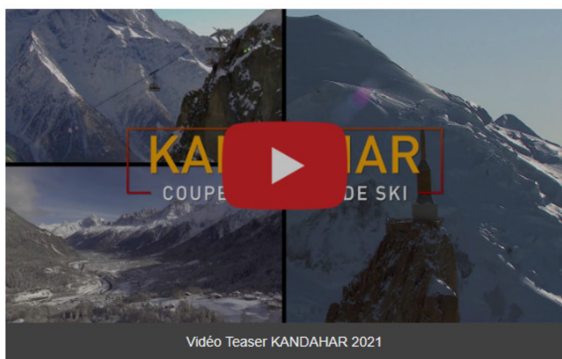
Vidéo Teaser KANDAHAR 2021